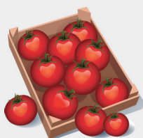
Produto: Tomate Safra: Jan – Abr / Out – Dez Entressafra: Mai – Set

Os preços de aquisição dos gêneros da agricultura familiar para a alimentação escolar devem ser compatíveis com os preços praticados no mercado local (§ 1º do art. 14 da Lei nº 11.947/2009). Daí a importância de o(a) nutricionista, na elaboração do cardápio, considerar o mapeamento da produção da agricultura familiar local (sazonalidade, quantidade e qualidade dos produtos), para assegurar produtos frescos e de qualidade às refeições dos estudantes, bem como preços mais adequados para execução do programa. No exemplo abaixo, considere: